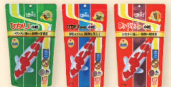
ひかり(基本フード) ひかり色揚(鮮やかな赤色に) ひかり胚芽(低水温時に)