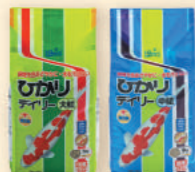
デイリー中粒 デイリー大粒