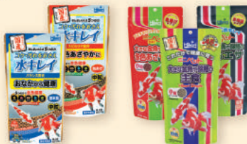
5つの力 中粒 シリーズ