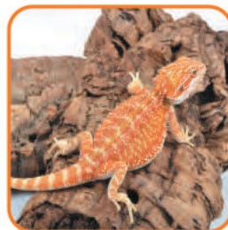
レッドレザーバック