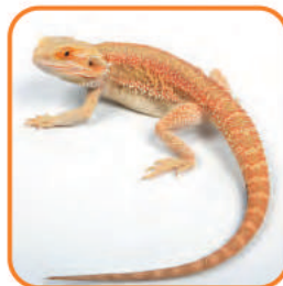
ハイポメラニスティック