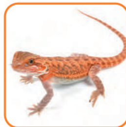
トランスルーセント