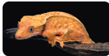
モザイクスーパーピンストライプ

※繁殖個体なので人になれやすく飼育しやすいよ。 ※たくさんの種類があるので、お気に入りの個体を探してね。