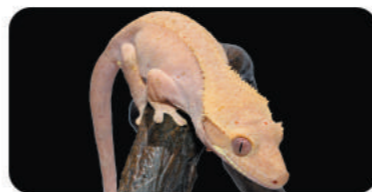
ブリックスクリーム