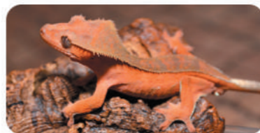
レッド/グリーンストライプ