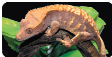
スーパーハーレクイン