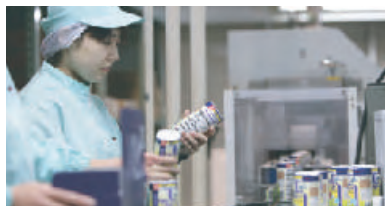
充填ライン Our “Clean Area” Packing Line

All Hikari® products are packaged in their appropriate package in our own “ultra clean” packing facility where strict contamination control procedures are followed.