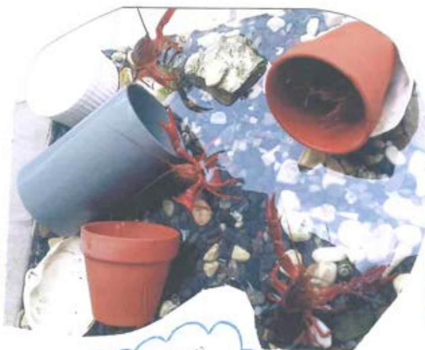
日取後まで大切に育てるよ