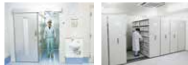
サンタリールーム

サンプル保管倉庫 全工場の製造飼料をロット別に3年間保管。常に品質を調査・分析できるようにしています。