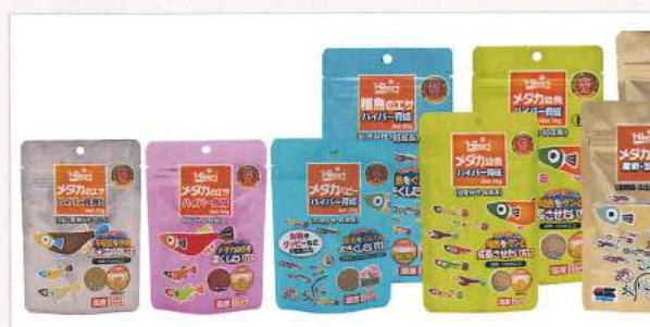
メダカのエサ「ハイパー」シリーズのラインアップ。幼魚用のほか、親用、色揚げ用、良消化タイプなど目的別に多様な商品を揃えている

また高カロリー配合で、豊富な栄養成分と高い嗜好性を実現。この点も幼魚の急速な成長につながる。 さらに同社の独自技術である、生きた善玉菌「ひかり菌」を配合しており、ひかり菌が幼魚の腸内でエサを消化吸収しやすいかたちに分解。腸内環境を適切に保ち、健康を維持することができるという特徴を持つ。 利用者からの使用実感が、高いリピート率を実現し、販売実績も発売以後、大きく成長している商品だ。