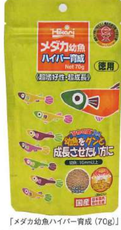
「メダカ幼魚ハイパー育成(70g)」

として投入されたもの。内容は同じメダカ用フードで、2年連続の受賞ということになる。 まずまず活発化するメダカ飼育ブームの中で、メダカ飼育層は増え、品種改良などで、収益をめざす飼育者も増えている。こうした中で、2021年に発売された28gタイプ「メダカ幼魚ハイパー育成」は、幼魚が食べやすく、より生育に適した上位クラスの商品として開発された。実際に利用してみると、順調にメダカが増え、産卵・孵化も起こるため、もっと大容量の商品が欲しい、というニーズが高まり、これに対応するかとちで22年に追加投入されたのが70gタイプということになる。